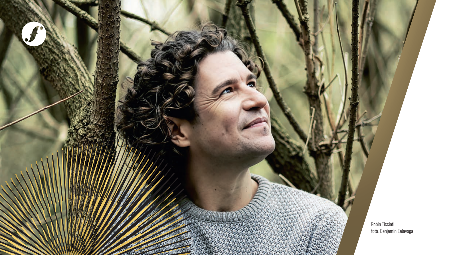
Robin Ticciati